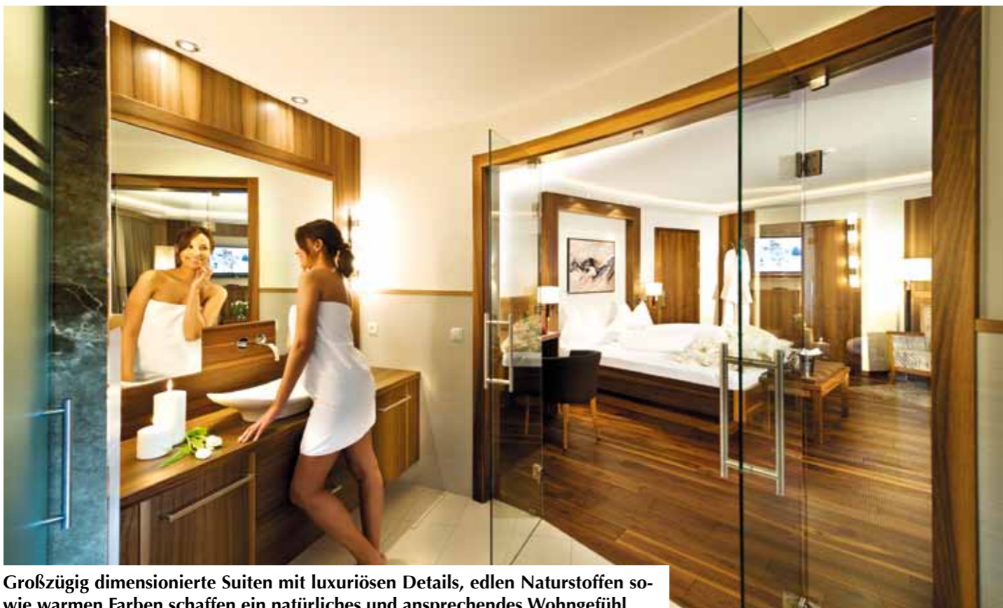
Großzügig dimensionierte Suiten mit luxuriösen Details, edlen Naturstoffen sowie warmen Farben schaffen ein natürliches und ansprechendes Wohngefühl.