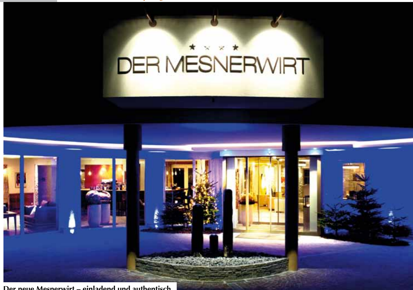
Der neue Mesnerwirt – einladend und authentisch.